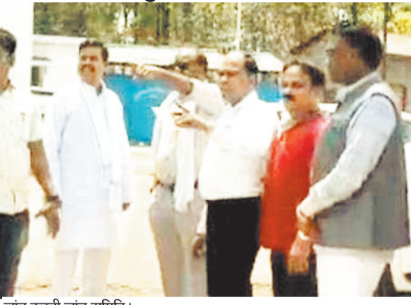
जांच करती जांच समिति।