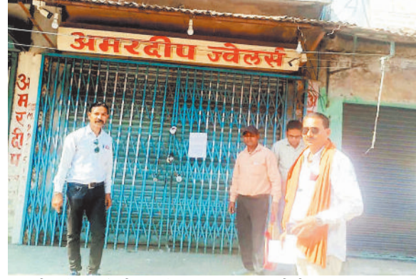
अमरदीप ज्वेलर्स को सील करते निगम टास्क व उसकी टीम।