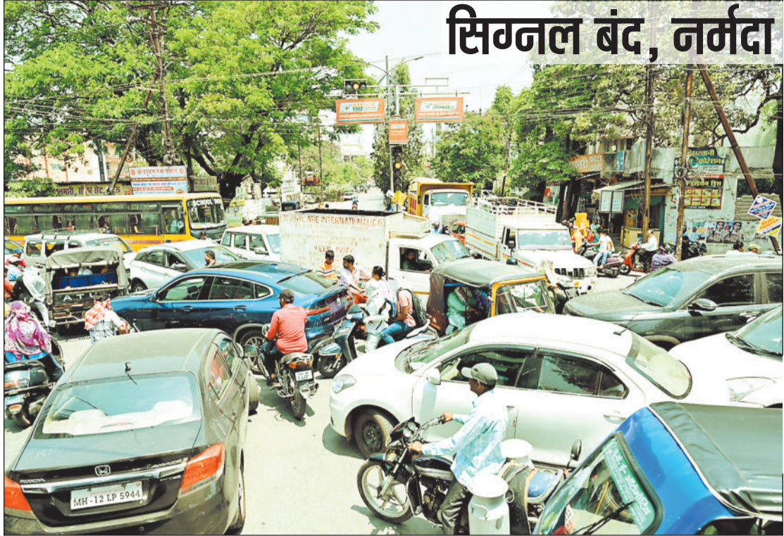
सिग्नल फेल: नर्मदा नगर चौक पर रोज लग रहा जाम। परेशान हो रहे लोग।