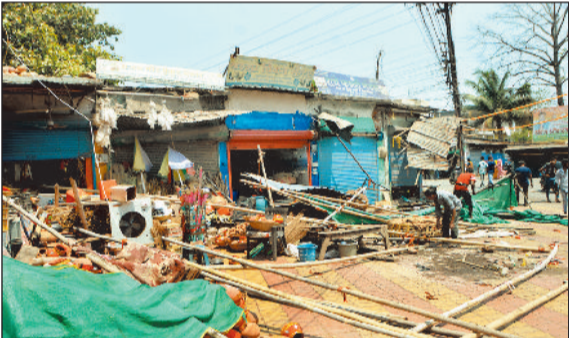
शनिचरी बाजार में अतिक्रमण हटाया गया।

ज्यादातर फुटपाथों पर अस्थायी दुकानें चलने लगी हैं। नेहरू चौक से मंगला चौक तक भी सड़क के दोनों ओर फुटपाथ पर कब्जा हो गया है। इस मार्ग में फुटपाथ पर अवैध रूप से 100 से ज्यादा दुकानों का संचालन हो रहा है। निगम की टीम ने बुधवार को यहां अभियान चलाया गया। खास तौर पर शेफर स्कूल के सामने से लेकर मुंगुली नाका चौक तक पीली लाइन के पार भी दुकानदारों ने सामान रख दिया था। इनके सामानों की जल्ती के साथ ही चेतावनी दी गई। यहां लगाए गए टैलों को हटाया गया। दरअसल सुबह के समय तो सड़क में भीड़ नहीं होने की वजह से फुटपाथ की आवश्यकता इतनी महसूस नहीं होती है। शाम को वाक करने वालों को दिक्कत होती है। शाम के समय लगभग सभी सड़कों पर यातायात का दबाव रहता है। ऐसे में सड़क पर वाक करना संभव नहीं हो पाता है।