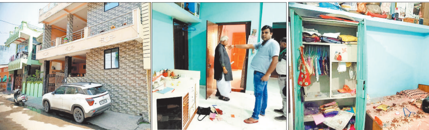
वह मकान जहाँ हुई चोरी की वारदात। घर के भीतर परिवार के सदस्य। टूटी हुई अलमारी जिससे ले गए जेवर।